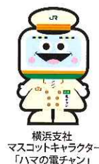
横浜支社 マスコットキャラクター 「ハマの電チャン」

JR東日本横浜支社の マスコットキャラクター 「ハマの電チャン」と、 東急線キャラクター「の るるん」登場予定!