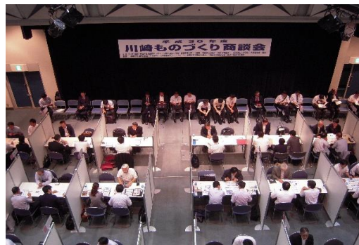
受・発注商談会（川崎会場）の様子

この度、関係団体との連携により、次のとおり開催いたしますので、ぜひ、ご参加くださいますようご案内申し上げます。